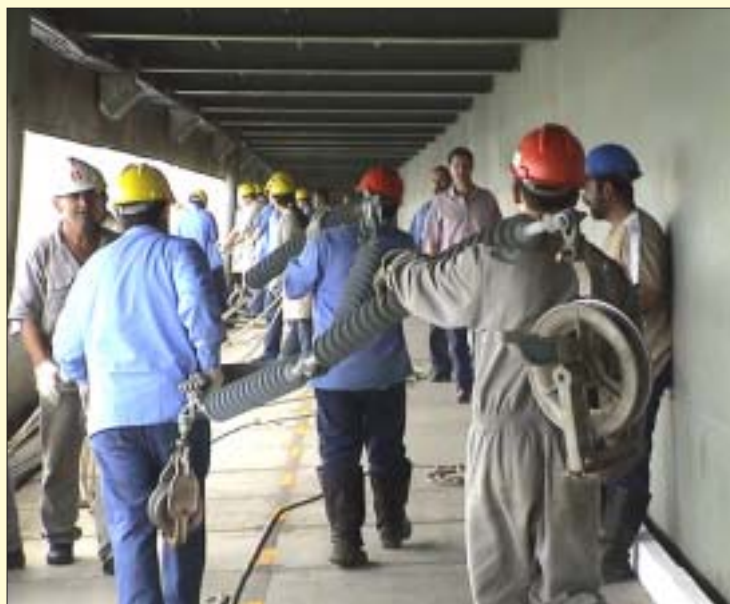
O Sintracimento parabeniza todos os trabalhadores

O dia é do trabalhador, mas quem recebe o presente são as empresas que têm ao seu lado pessoas tão dedicadas e dispostas a ir cada vez mais longe. Parabéns pelo seu dia!