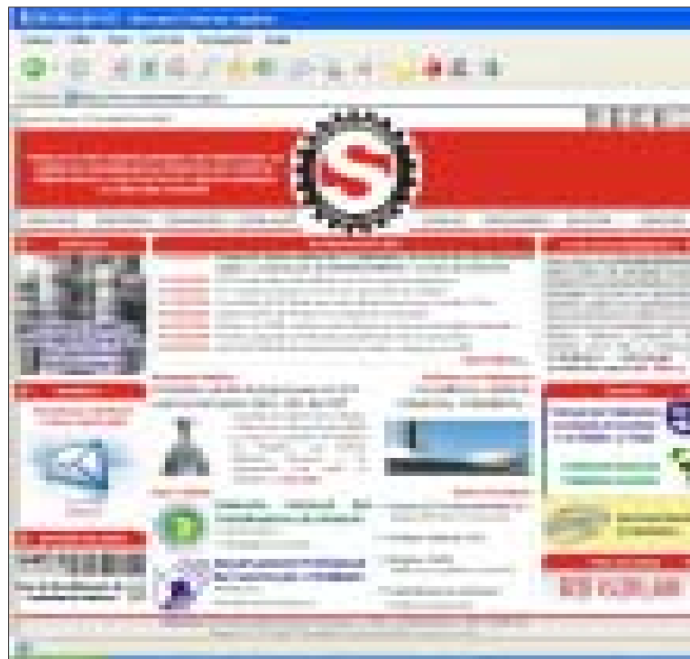
A página do sindicato na internet trás diversas informações

Vale destacar que as matérias sobre o movimento sindical são atualizadas diariamente.