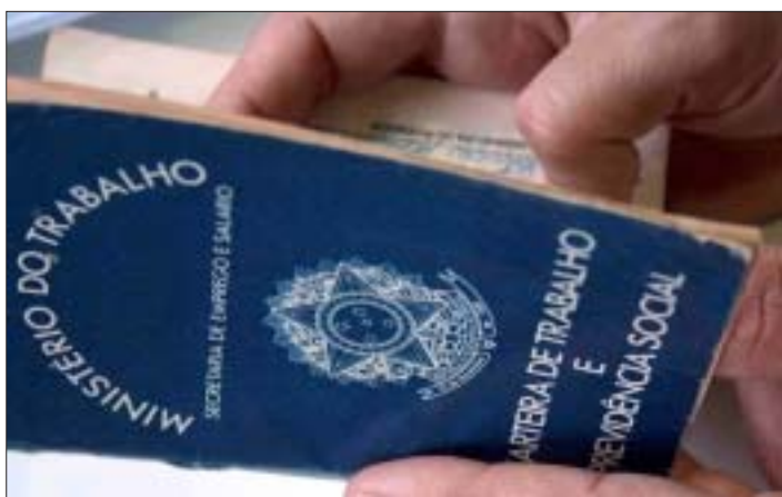
As negociações salariais da categoria foram um dos assuntos discutidos durante a Assembleia

Com as propostas em mãos, o sindicato não está medindo esforços para transformar essas reivindicações em realidade. No dia 17 de abril, o Sintracimento participou de uma reunião de sistematização com todos os sindicatos, em Imbituva. As discussões foram positivas e na próxima edição serão divulgados os resultados das negociações.